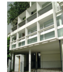
Le Corbusier Casa Curutchet - La Plata

Mario Roberto Álvarez [1913-2011] Quien diseñó nuestro museo, perteneció a esta corriente arquitectónica del Movimiento Moderno, que marcó una ruptura radical con las formas compositivas tradicionales. Otras de sus obras son: Teatro General San Martín, Centro Cultural General San Martín, Club Hípico Argentino, Edificio SOMISA, Remodelación del Teatro Colón, Torre IBM, Sanatorio Güemes, Edificio American Express, Art Tower, Torres del Libertador, Torre Le Parc, Museo de Esculturas Luis Perloti, etc.